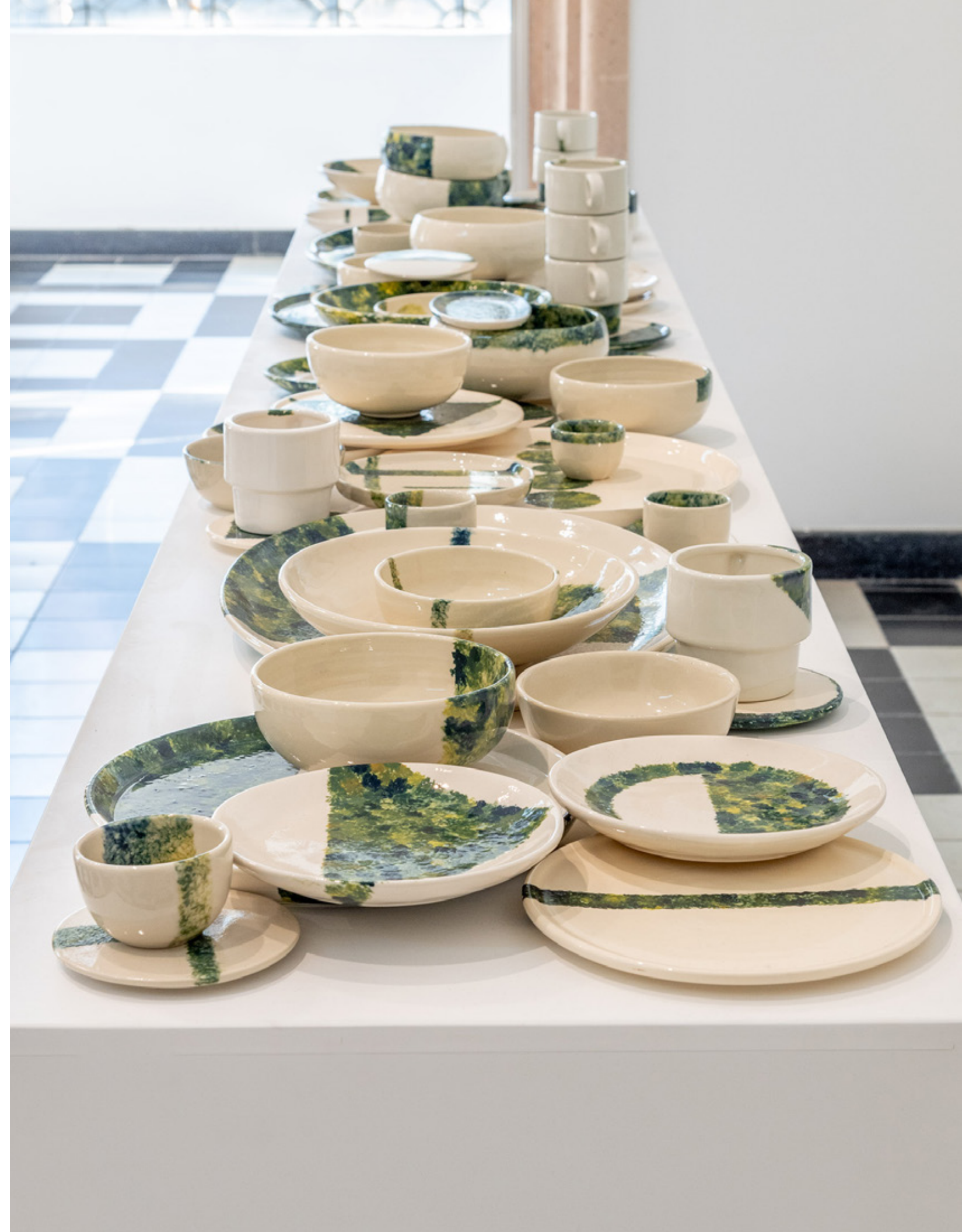
La Gran Tajada 2025 Cerámica esmaltada pintada a mano Medidas variables PLM-LAV25-03 Pieza única