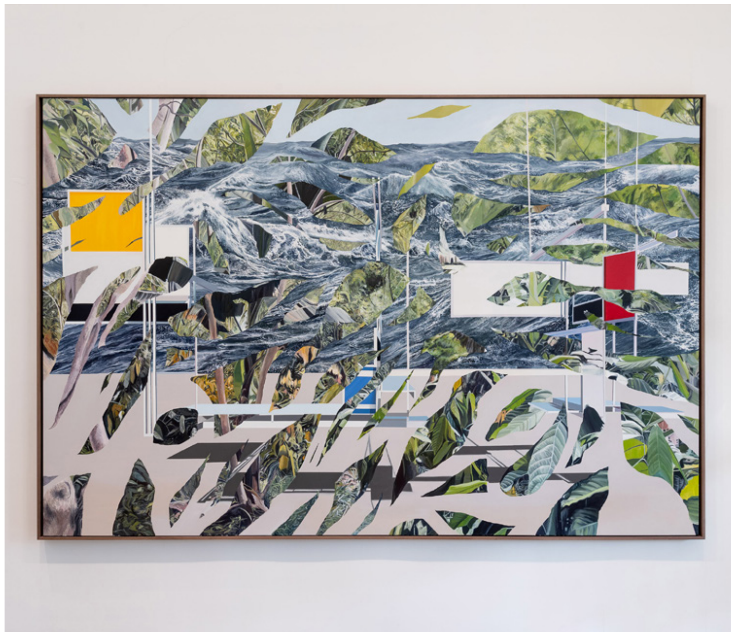
Tajo (La Plataforma) 2025 Acrílico sobre tela 200 x 300 x 10 cm PLM-LAV-01 Pieza única