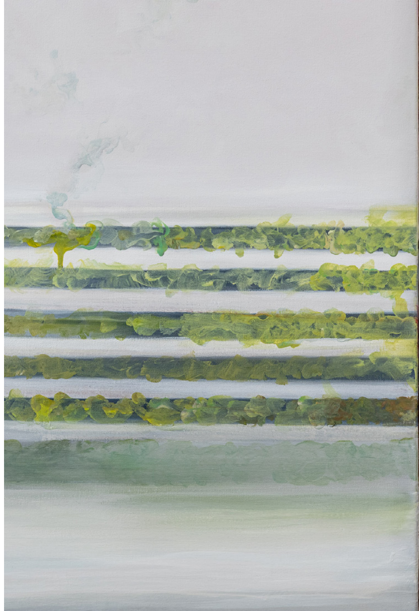
TC100 2025 Acrílico sobre tela 140 x 200 x 10 cm PLM-LAV25-02 Pieza única