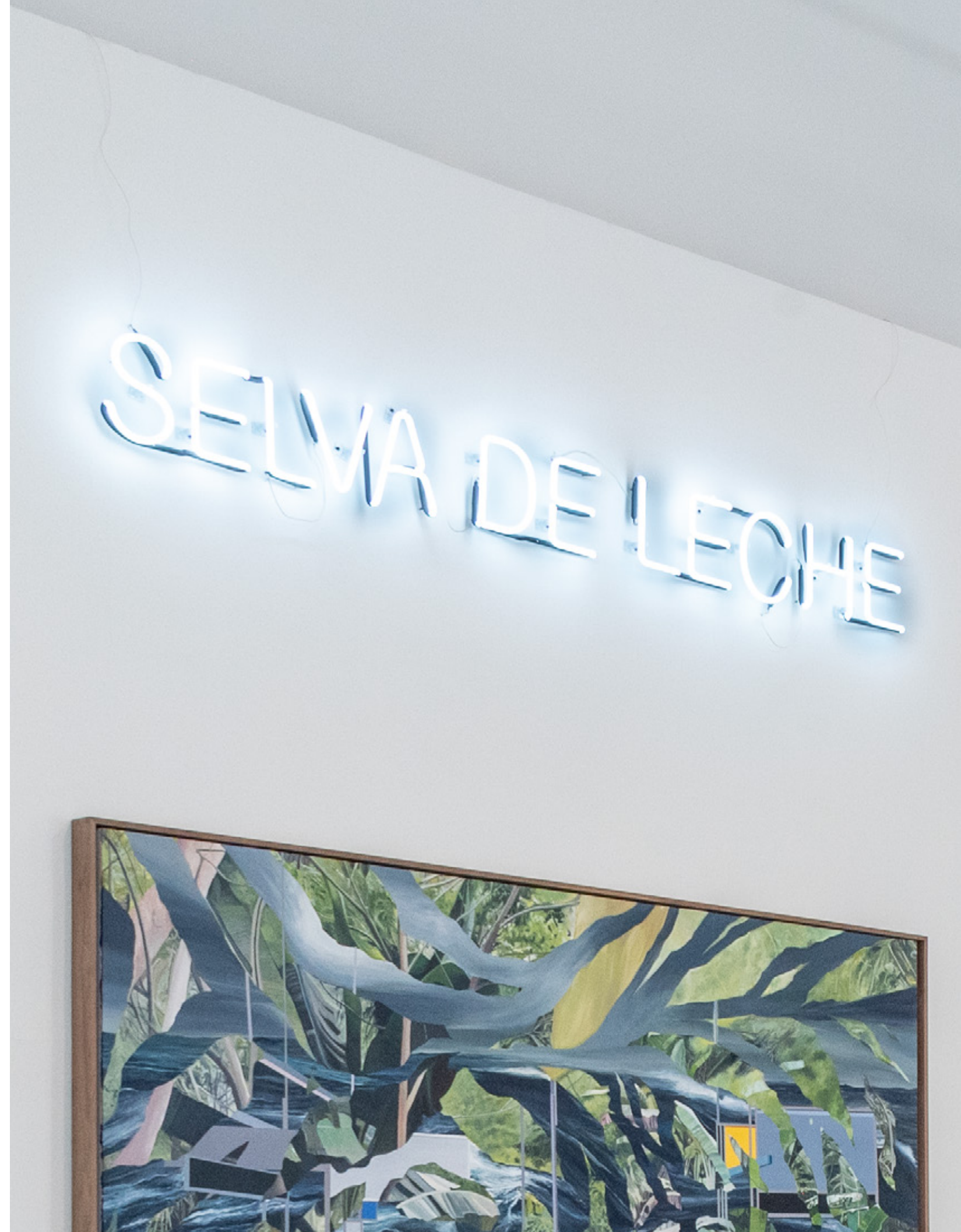
Selva de leche 2025 Neón 196 x 20 x 4 cm PLM-LAV25-04 Edición de 3