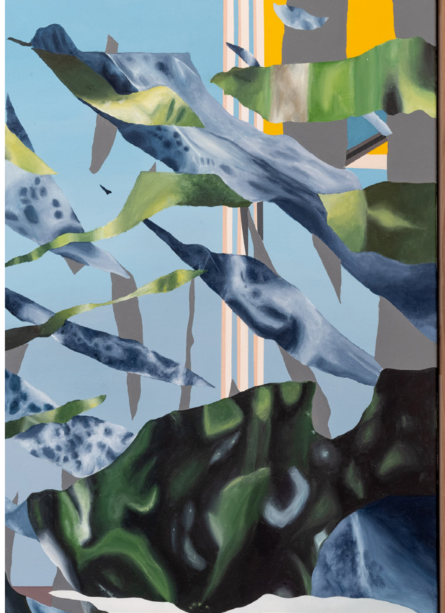
Explllt 2025 Acrílico sobre tela 123 x 183 x 10 cm PLM-LAV25-06 Pieza única