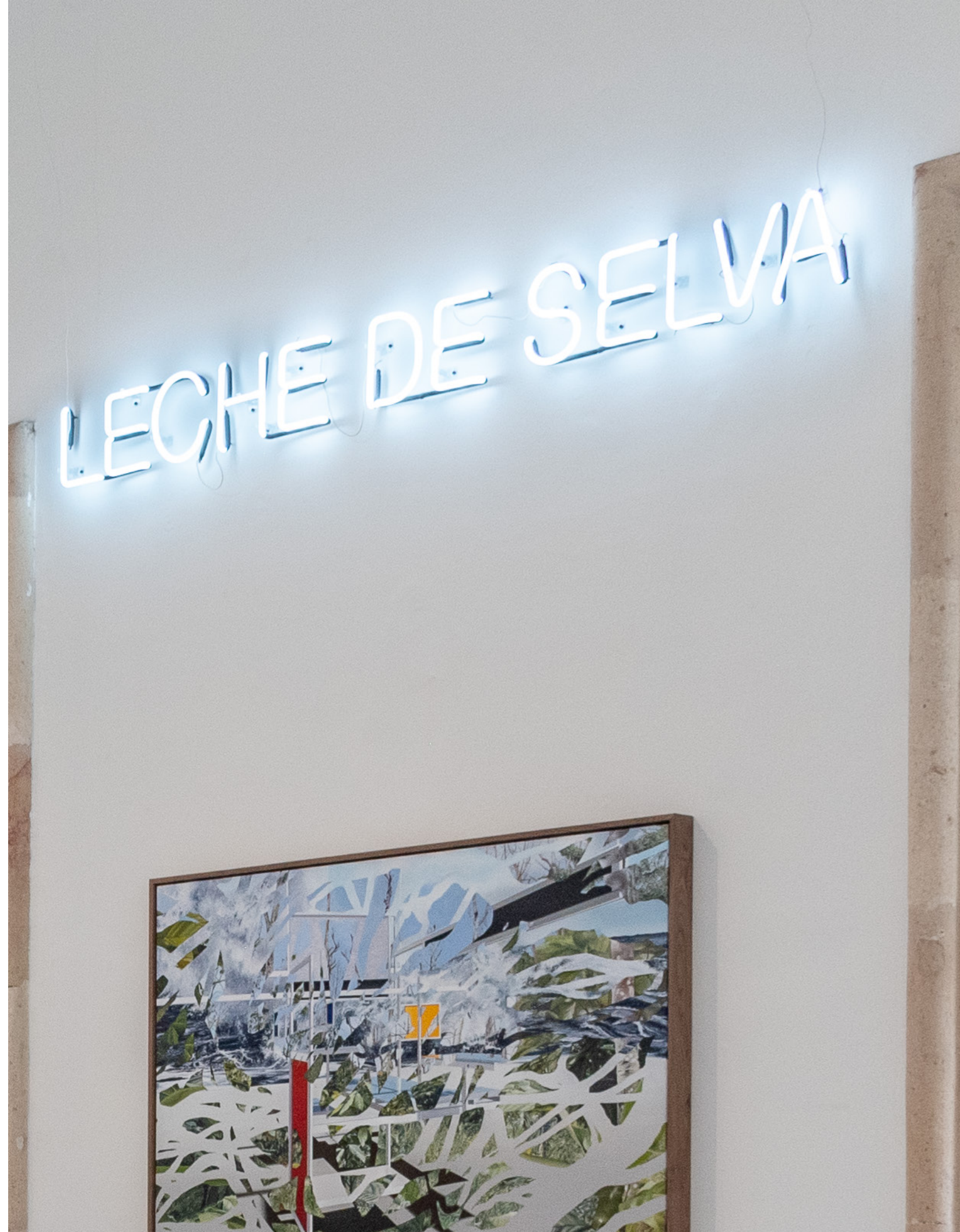
Leche de Selva 2025 Neón 198 x 20 x 4 cm PLM-LAV25-07 Edición de 3